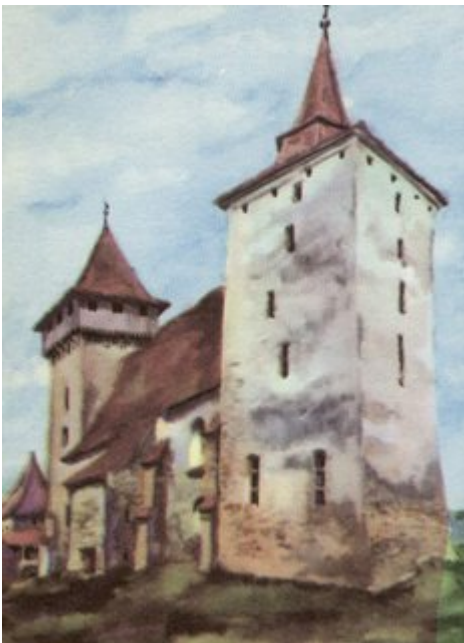
Die Wehrkirche von Hundertbücheln

Von der romanischen Basilika, die in Neppendorf - Turnisor an der Schwelle des 13. Jahrhunderts entstand, sind nach der türkischen Brandschatzung von 1493 Chor, Hauptapsis und Osthälfte des südlichen Seitenschiffes mit einer Apsidole übrig geblieben; die Turmruine über dem Mittelschiff wurde im 18. Jahrhundert neu ausgebaut.