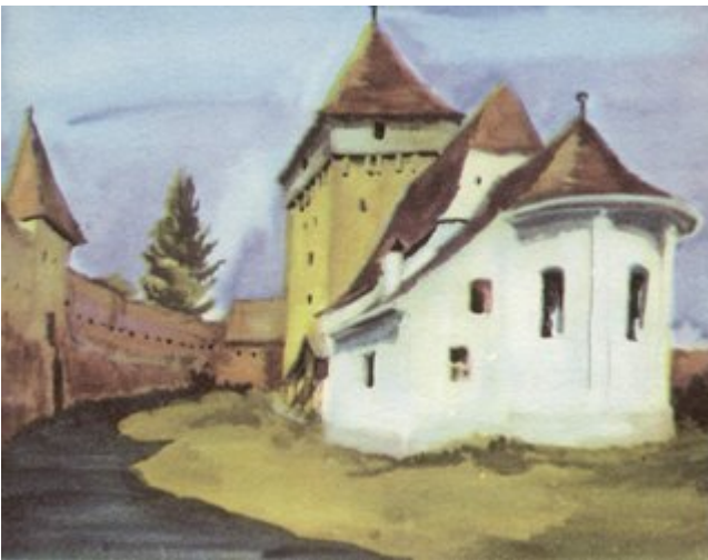
Holzungen besitzt eine der besterhaltenen Kirchenburgen

In Jakobsdorf - Iacoben entstand im 14. Jahrhundert eine turmlose spätgotische Saalkirche, die um 1500 durch Anbau eines massiven Bergfrieds im Westen und eines Verteidigungsturmes über der Sakristei im Nordosten wehrbar gemacht wurde. Chor und Schiff umzieht ein auf Strebepfeilern und Arkadenbogen ruhender Wehrgang mit Schieß- und Gußcharten.