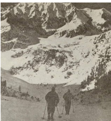
Auf den Skiern zum Galasescu