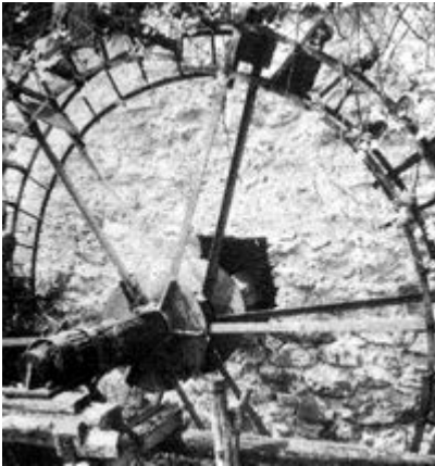
Das eiserne Schaufelrad einer Wassermühle bei Reschitza

Der dritte Tag gilt der Besichtigung einer der repräsentativsten Höhlen des Banater Karsts: Der Komarnik- Höhle. Sie ist eine