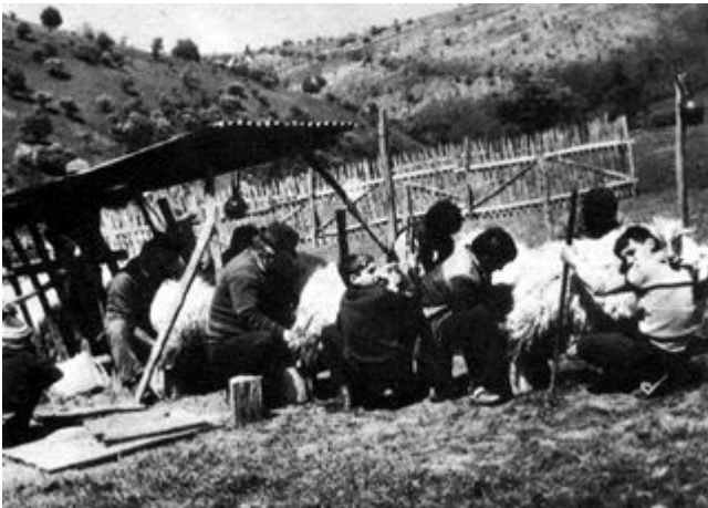
Bei einem der Schaffferche im Banater Karstgebiet: einmal im Jahr - Anfang Mai, melkt der Besitzer seine Schafe - so wird sein Anteil Käse errechnet

des Baches, wo der Pfad nach rechts bergan führt. Im bald folgenden Waldstück ein anderer Pfad, der von den Herdenunterkünften der Einheimischen kommt und die obere Schluchtkante entlang zur Prolaser Burg führt. Wir folgen diesem Pfad. Wenn wir das Waldstück verlassen, liegt weit unten das Panorama der Prolas- Schlucht. Der Pfad macht eine leichte Rechtsbiegung, und bald treffen wir auf einen Hügelkamm, der vom 592 Meter hohen Pasac-Gipfel bis ins Tal führt. Hier müssen wir uns entscheiden, welcher Variante wir folgen wollen.