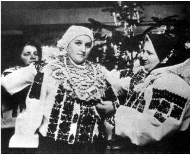
Eine kraschowänische Braut wird für die Hochzeit zurechtgeputzt